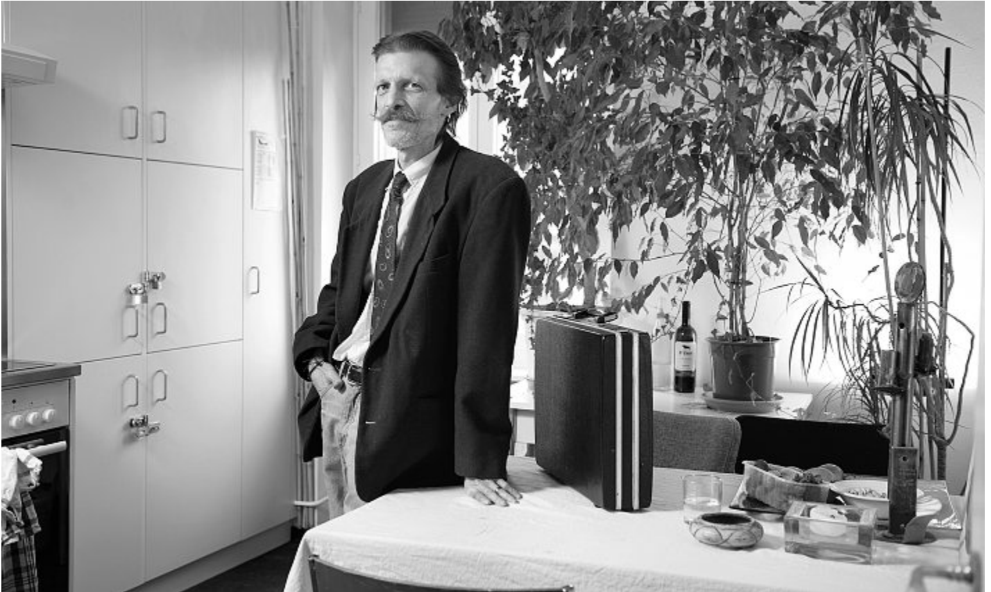
«Mein Krankenkassendossier wurde automatisch vom Sozialamt übernommen. Ich wurde nie gefragt.»